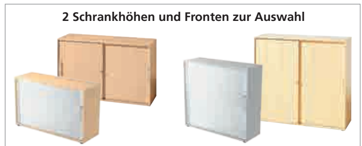
2 Schrankhöhen und Fronten zur Auswahl