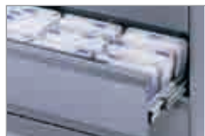
Karteischränke mit 2 Pendelblechen pro Bahn