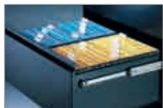
Hängeregistraturschränke mit geschlossenen Schubladenböden