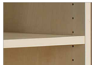
höhenverstellbare Fachböden im Raster von 32 mm