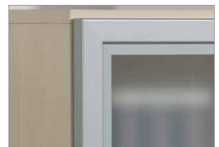
Glastüren mit stabilem Holzrahmen