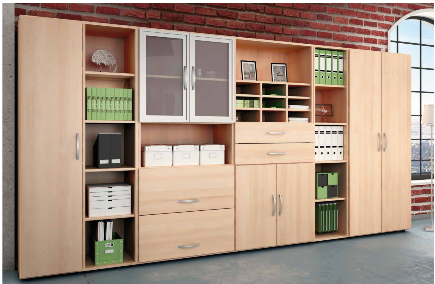
Abb. zeigt Dekor Ahorn