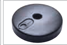
[2] rund aus Kunststoff, befüllbar