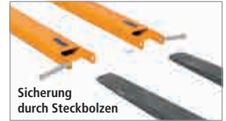
Sicherung durch Steckbolzen