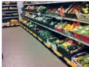
Kann auch direkt im Verkaufsraum verwendet werden.