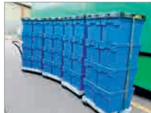
Per Kupplung lassen sich mehrere Paletten-Rollwagen zu einem Zug verbinden.