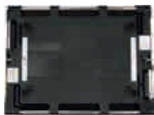
Deckel von oben