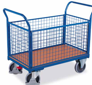
14 mit 4 Gitterwänden, Seitenwände herausnehmbar - für die flexible Anpassung an kleine oder sperrige Güter