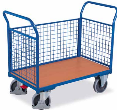
13 mit 3 Gitterwänden, 1 herausnehmbar - für den gestützten Transport und leichtes be- und entladen