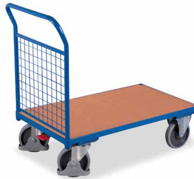
11 mit 1 Gitterstirnwand