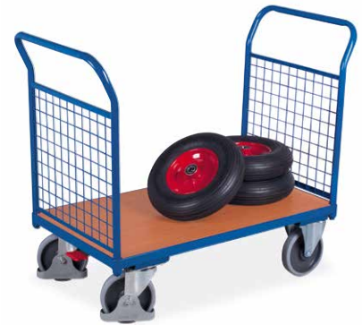
12 mit 2 Gitterstirnwänden - stützt gestapelte Güter auch beim Bremsen