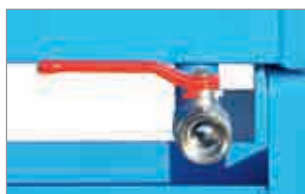
Ablasshahn 1" (bei Späne-Kippwagen)