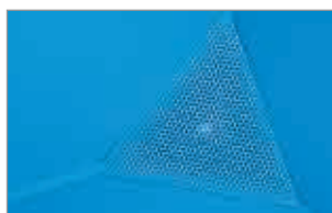
Siebblech (bei Späne-Kippwagen)