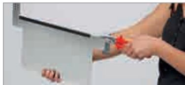
einhängbare Etikettenhalter siehe Seite 429