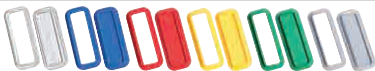
Griffvarianten in individuellen Farben auf Anfrage ab 200 Stück lieferbar.