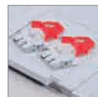
2 Scharnier- und 2 Schiebeschnappverschlüsse

! Die Deckel werden standardmäßig ohne Verschlüsse als Auflagedeckel geliefert, für die Verschieb- oder Scharnierfunktion müssen die entsprechenden Verschluss-Sets separat bestellt werden.