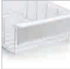
Etiketten mit Schutzscheibe Polystyrol