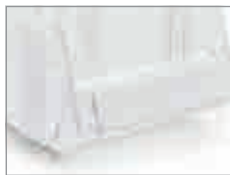
Etiketten mit Selbstklebefolie