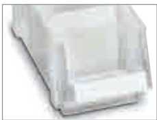
Querteiler aus grau beschichtetem Stahlblech