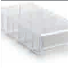
Querteiler aus glasklarem Polystyrol