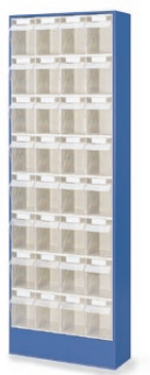
32 x C BA100606