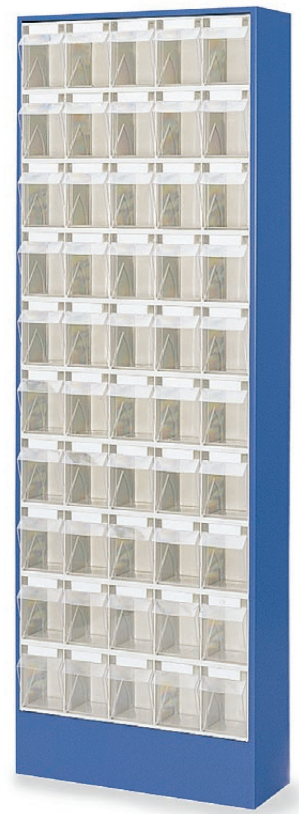
50 Kästen Größe B BA100581