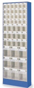
24 x A, 15 x B, 9 x D BA880185