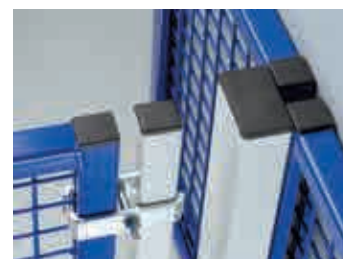
T-Pfosten für rechtwinkelige Wandabgänge