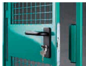
Flügeltür mit Anschlag, Drückergarnitur und Schloss (ohne Zylinder)