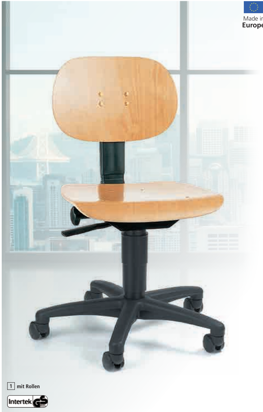
1 mit Rollen