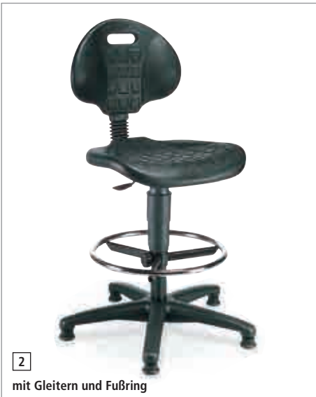
2 mit Gleitern und Fußring