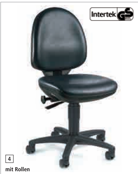
4 mit Rollen