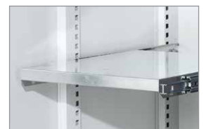
Auszugboden als Zubehör