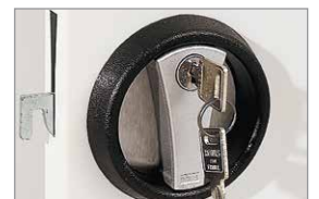
3-riegeliges Sicherheitszylinderschloss mit versenktem Drehgriff