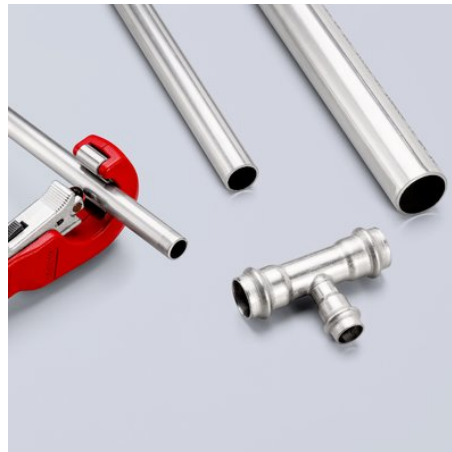
Schneller im Arbeitsalltag: Dank QuickLock-Einhandschnellfixierung rutscht das Schneidrad mit einem einzigen Daumendruck an jeden Rohrdurchmesser heran