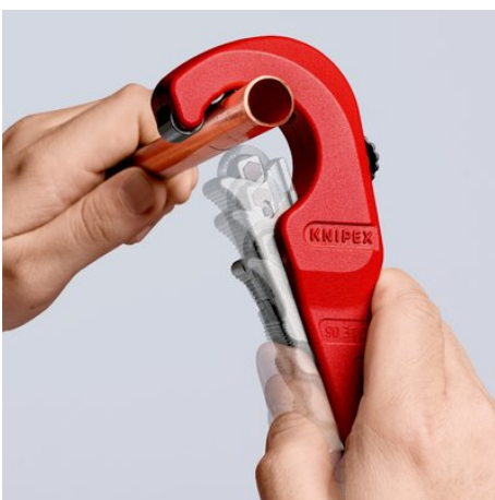
Die neue Leichtigkeit des Schneidens: geöffneten KNIPEX TubiX® Rohrschneider ansetzen ...