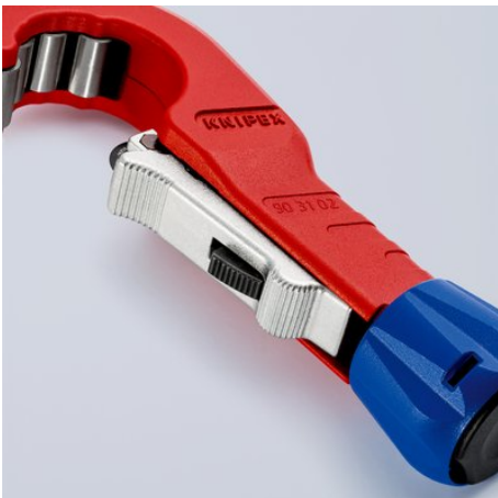
Durch die Einhandschnellfixierung kann das abgedeferte Schneidrad an den Durchmesser des Rohres herangeschoben und fixiert werden