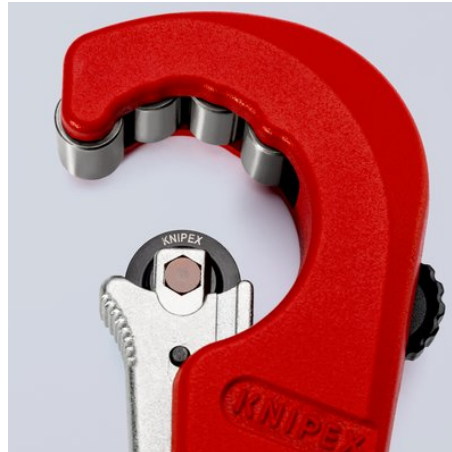
Das nadelgelagerte und abgedeferte Schneidrad aus hochwertigem Kugellagerstahl ist leicht wechselbar