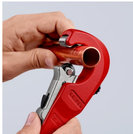
Schneidrad mit QuickLock-Einhandschnellfixierung ans Rohr schieben: schnelle Einstellung an unterschiedliche Rohrdurchmesser ...