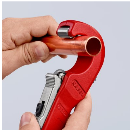
Die neue Leichtigkeit des Schneidens: geöffneten KNIPEX TubiX® Rohrschneider ansetzen ...