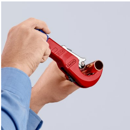
Durch Drehung schneiden und dabei mit dem ergonomischen blauen Drehknopf nachstellen ...