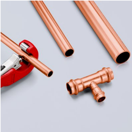
Zum Schneiden von Kupfer-, Messing-, Edelstahl- und Stahlpanzerrohren mit einer Wandstärke bis 2 mm und einem Durchmesser von 6 - 35 mm (1/4" - 1 3/8")