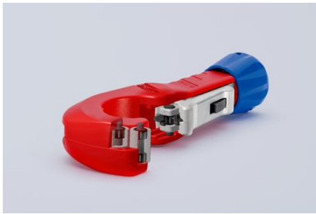
Das Schneidrad und die vier Führungsrollen laufen dank hochwertiger Nadellager beim Schneiden praktisch ohne störende Reibung – schneidet Edelstahlrohre besonders leicht