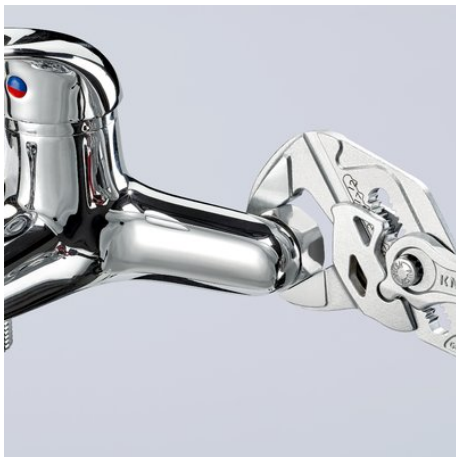
Arbeiten auf verchromter Armatur, ohne Beschädigung der Oberfläche