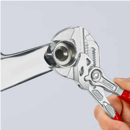
Arbeiten auf verchromter Armatur, ohne Beschädigung der Oberfläche