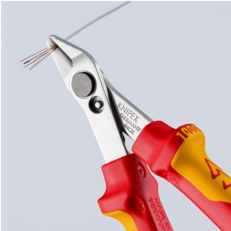
Für Einsätze unter Spannung bis 1000 V