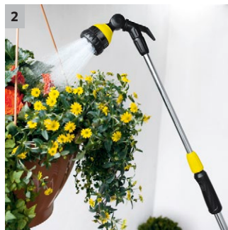
2 Teleskopstange (70-105 cm)