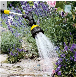
1 6 Sprühbilder