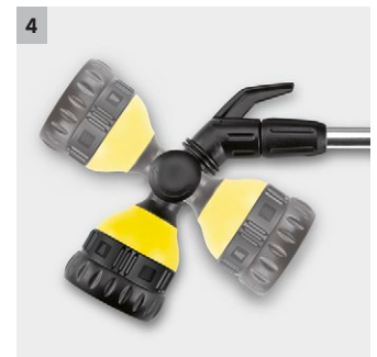
4 Beweglicher Sprühkopf (180°)