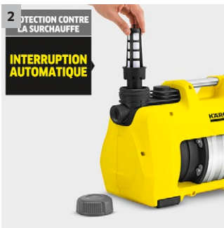
2 Sûr et longue durée de vie