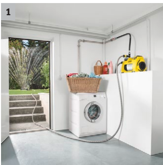
1 Facilement utilisable pour la maison et le jardin