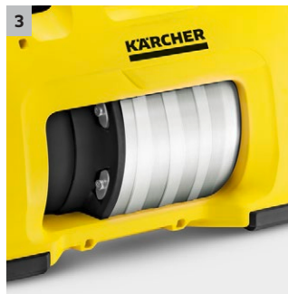
3 Pompe multicellulaire