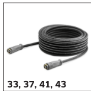
33, 37, 41, 43