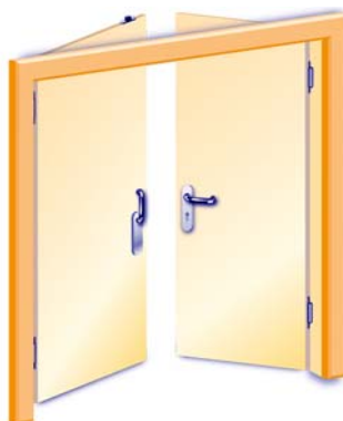
2-flügelig, Innenseite, mit Drücker