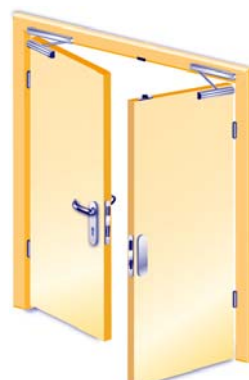
2-flügelig, Aussenseite mit Drücker