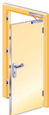
1-flügelig, Aussenseite mit Drücker, 3-Punktverriegelung