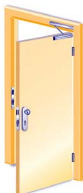
1-flügelig, Aussenseite mit Knopfschild