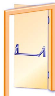
1-flügelig, Innenseite, mit Druckstange