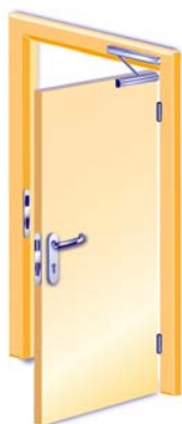
1-flügelig, Aussenseite mit Drücker, 1-Punktverriegelung