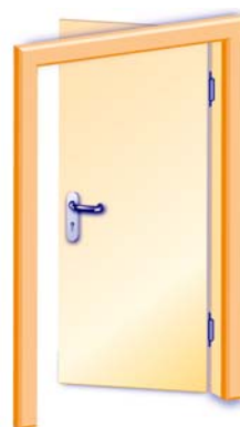
1-flügelig, Innenseite, mit Drücker