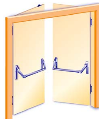
2-flügelig, Innenseite, mit Druckstange