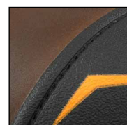
GÜK mit versenkten Nähten