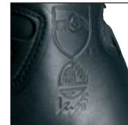
Schnittschutz Level 1