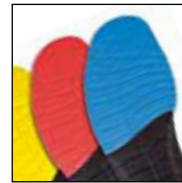
Vario Wide Fit System